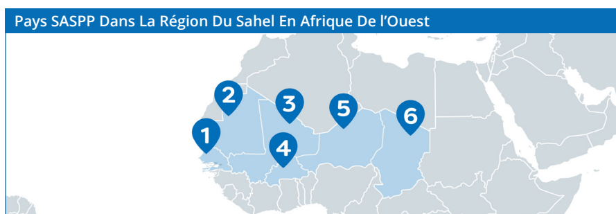
Figure 1. Programme De Protection Sociale Adaptative Pour Le Sahel (SASPP).

Au Niger, plus de 10 millions de personnes (42 pour cent de la population) vivaient dans l'extrême pauvreté en 2021. 3 L'économie du Niger est peu diversifiée, l'agriculture représentant 40 pour cent du produit intérieur brut (PIB) et constituant la principale source de subsistance. 4 Plus de 90 pour cent des ménages nigériens ont un membre qui se consacre à l'agriculture, mais la production est dominée par une agriculture de subsistance à faible productivité avec un faible accès au marché. 5 Seuls 25 pour cent des agriculteurs commercialisent leurs cultures et seuls 10 pour cent des villages disposent d'un marché permanent. Les activités non agricoles sont rares en tant qu'occupation principale dans les zones rurales (moins de 10 pour cent), mais constituent une occupation secondaire pour environ un tiers de la population. Le secteur salarié n'emploie que 4 pour cent de la main-d'œuvre, principalement dans des emplois du secteur public concentrés dans la capitale. Plus d'un tiers des femmes nigériennes ne travaillent pas en dehors de leur foyer, en grande majorité à cause de la charge des tâches ménagères. 6